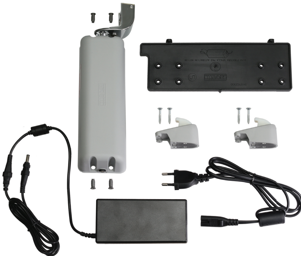
арт. AUTMTNKTG Электропривод для Motion-V