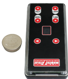
арт. SWCO02500 Пульт управления электроприводом для Automation Motion-V