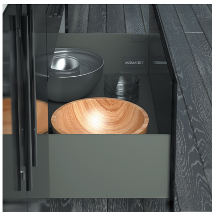
M-IND2.KIT.500C.OG комплект ящика Indigo H = 175, L = 500, отделка орион серый