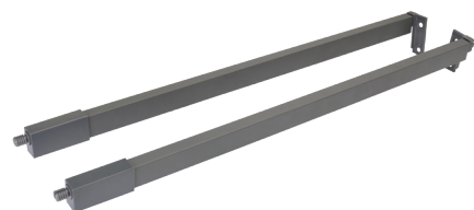
M-IND.RS2.500.OG комплект рейлингов для ящика Indigo L = 500, отделка орион серый