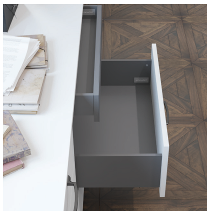
M-IND2.KIT.500A.OG комплект ящика Indigo H = 90, L = 500, отделка орион серый